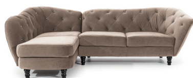
narożnik > corner sofa OL+3P 1. paczka | package - OL - 185x120x70 cm (1,55m 3 , 38,5kg) 2. paczka | package - 3P - 170x90x70 cm (1,07m 3 , 35,5kg)