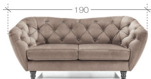
sofa > sofa 2 1. paczka | package - 195x90x70 cm (1,23m 3 , 41kg)