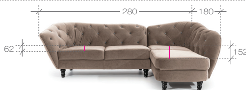
narożnik > corner sofa 3L+OP 1. paczka | package - OP - 185x120x70 cm (1,55m 3 , 38,5kg) 2. paczka | package - 3L - 170x90x70 cm (1,07m 3 , 35,5kg)