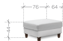
pufa > pouf 1. paczka | package - 80x70x30 cm (0,17m 3 , 11kg)